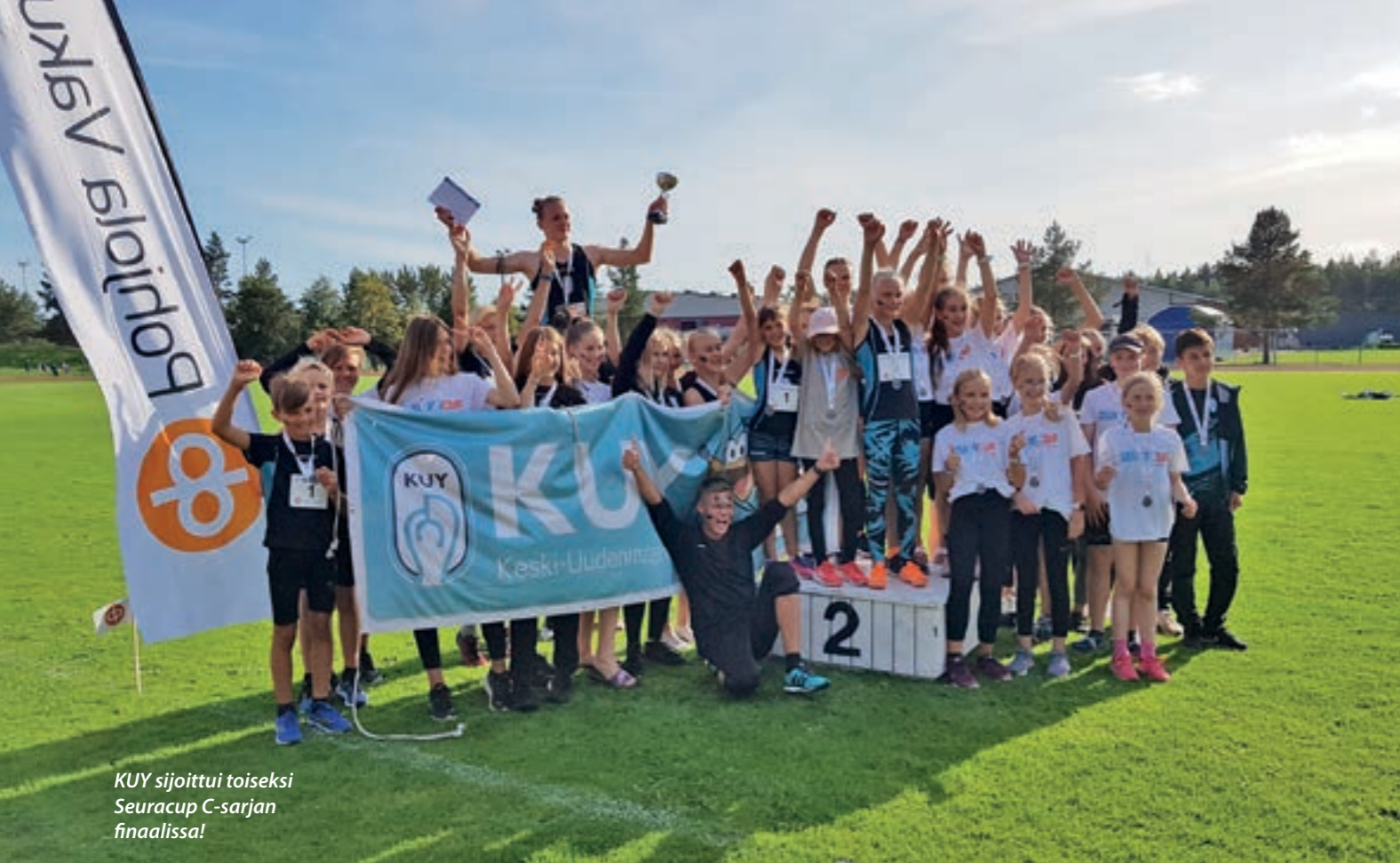
KUY sijoittui toiseksi Seuracup C-sarjan finaalissa!