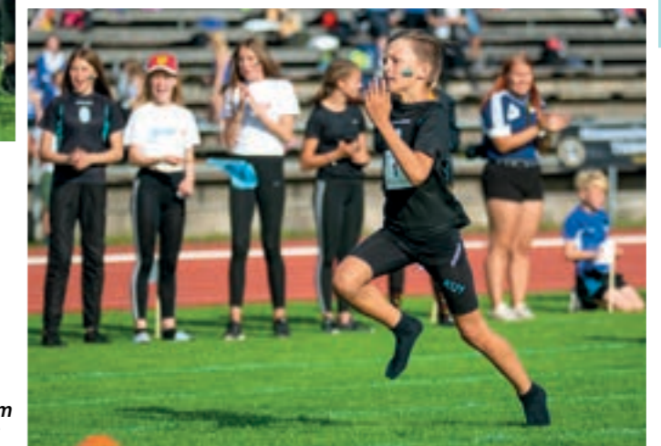
Finaali huipentui 16x60m sukkulaviestin voittoon!