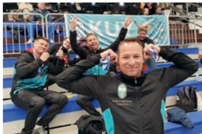
Aikuisen treeniryhmässä treenataan tosissaan, mutta ei tosikkona.