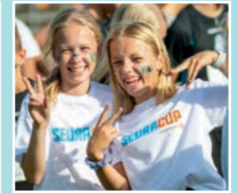
Seuracup on urheilu- ja joukkuehengen juhlaa!