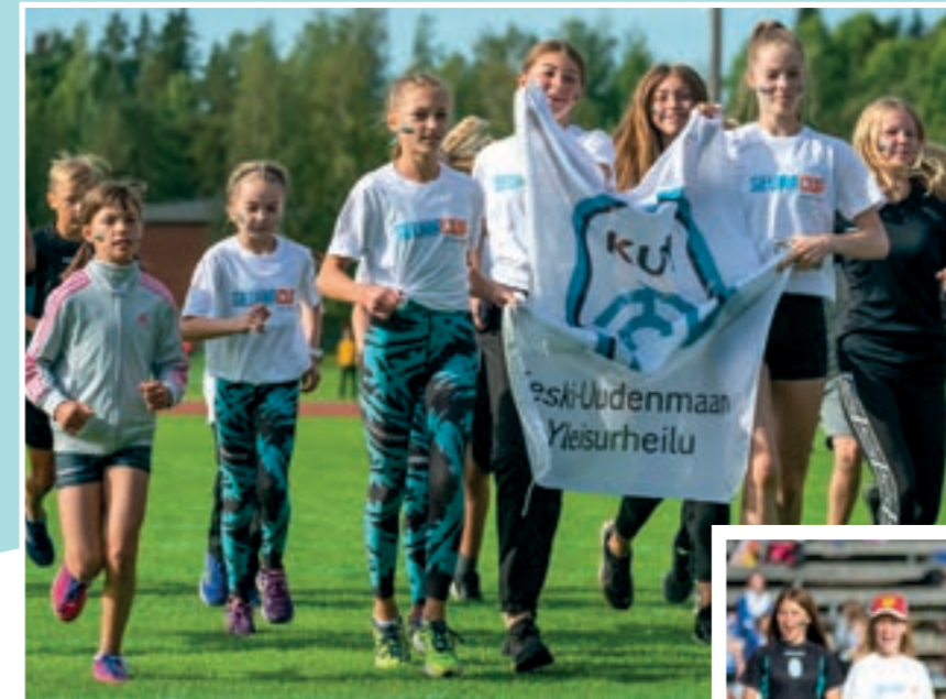
KUY:n joukkue saapuu stadionille!

sesti seuracup joukkueet ovat päässeet seuraamaan Ruotsi-Ottelua stadionille oman kisapäivän jälkeen. Rohkaisemmekin kaikkia yleisurheiluvia nuoria lähtemään mukaan unohtumattomalle Seuracup kisareissulle jälleen ensi vuonna!